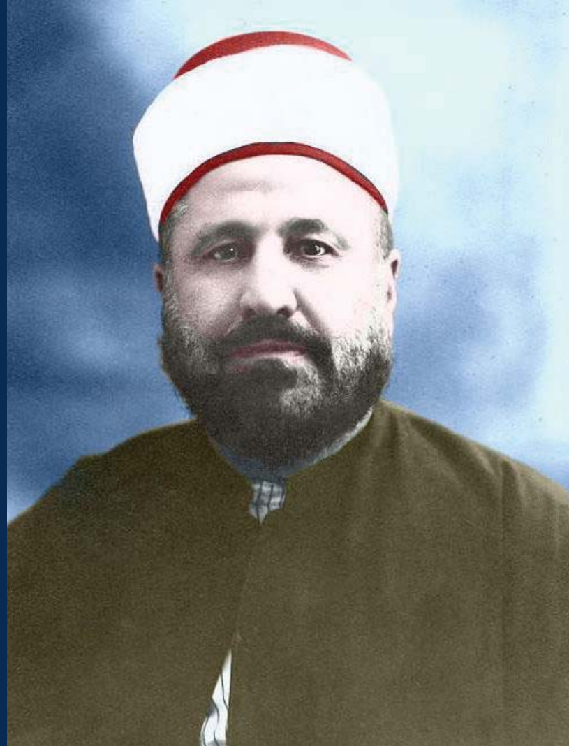
Sheikh Rashid Rida